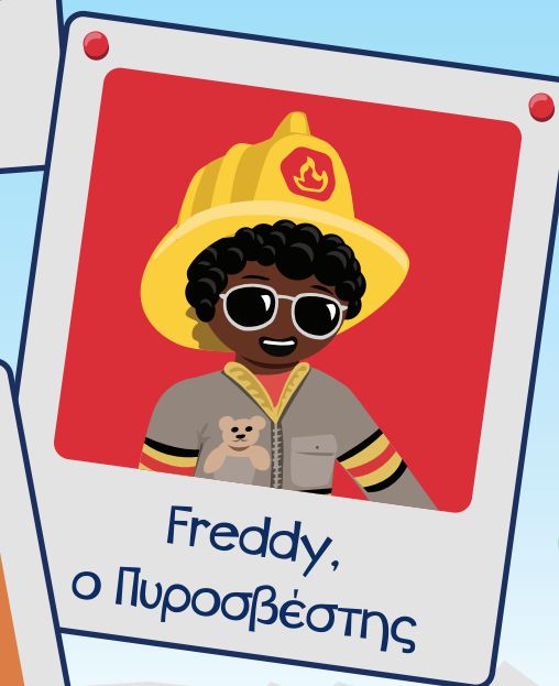
Freddy, ο Πυροσβέστης