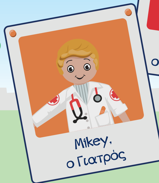
Mikey, ο Γιατρός