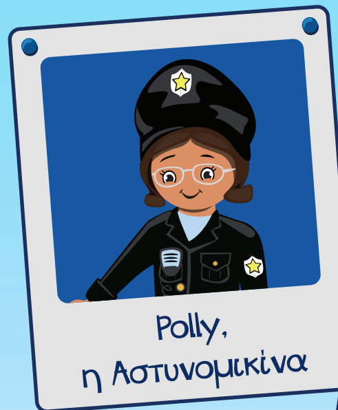
Polly, η Αστυνομικήνα

Γεια σας! Είμαι ο Ducklas και αυτή είναι η παρέα μου!